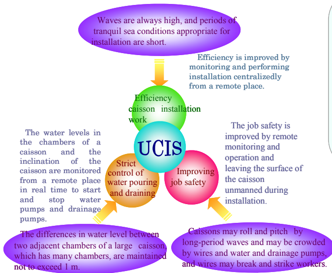
図-1 UCIS 開発の背景

UCIS は、ケーソン据付時にケーソン上で人手により行っていた一連の作業を、遠隔から無線 LAN を用いて据付けることを可能とする海上工事における無人化施工技术である。これにより、ケーソンへの注水およびウィンチ操作等のケーソン据付作業は現場から離れた遠隔監視・操作室から 1 人で行え、大幅な省力化が可能となる。また、ケーソン上は無人数となりケーソン据付作業に対する安全性が格段に向上するとともに、ケーソンの動態や注排水等を一元管理できることから、IT 施工によるケーソン据付の高効率化と高精度化も果たすこととなる。本稿では、当該システムが有する機能を述べるとともに、導入事例について紹介する。